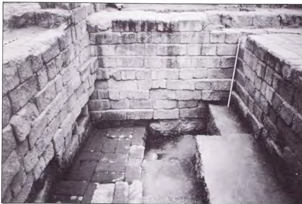
LÁMINA IV. Interior de la cella, desde el Oeste.

paña se descubrió el muro de separación entre pronaos y cella , de 3'20 m. de anchura, construido con sillares de arenisca de unos 0'50 m. de altura, 0'60 m. de anchura y una longitud variable. Estos sillares se disponían por parejas, alternando soga y tizón. Asimismo, se procedió al descubrimiento parcial de dos muros correspondientes a los lados mayores de la cella , en un tramo que coincide con la conexión con el muro de separación entre pronaos y cella . Estos dos segmentos de muro poseen una anchura de 4'75 m. y su técnica constructiva es idéntica a la del muro anteriormente citado, es decir, parejas de sillares con alternancia de soga y tizón. Finalmente, se inició la excavación del espacio interior comprendido entre los muros de la cella y pronaos , ocupado por un relleno de tierra.